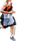
DIM. 3 JUILLET LES FOULIES DE BRETAGNE Chantenay, en Loire-Atlantique, cette course disputée sur 13,5 km est l'un des événements phares de la région de Nantes. Elle rassemble chaque année des milliers de coureurs amateurs et professionnels. Le départ sera donné à 10h, en partant de la place de la République. Plus de 350 bénévoles et donateurs ont été recrutés pour assurer le bon déroulement de la course. www.jeuxdebretagne.fr